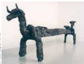
Capfoguer de ferro, s. IV-III aC