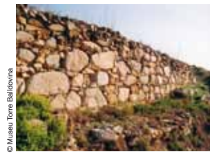
Mur del sistema defensiu