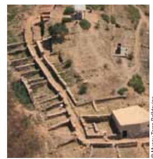
Vista aèria parcial