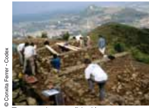
Tasques de consolidació