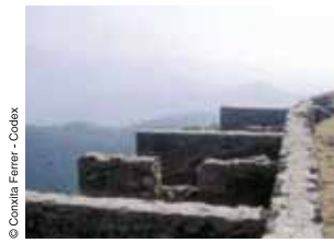
Carrer i habitatges restaurats