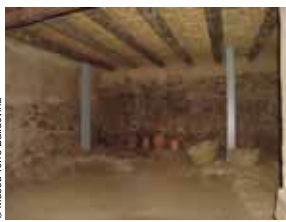
Interior de la casa reconstruïda

Estació didàctica que conté sis interactius per aprofundir en alguns aspectes de la cultura dels ibers amb informació complementària: L'iconoscopi : ensenya com era el poblat en el passat. El diari de camp de l'arqueòleg : permet aproximar-se al mètode científic simulant un diari d'excavació. Les finestres de l'enigma : donen informació diversa a partir de plantejar qüestions. L'estratigrafia : diferents calaixos simulen els estrats amb rèpliques d'objectes significatius cronològicament. L'escriptori ibèric : dona a conèixer l'alfabet ibèric i les equivalències amb els sons actuals. El cronòleg : contextualitza la cultura ibèrica amb fets i altres cultures coetànies.