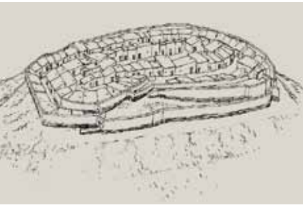
Reconstrucció hipotètica del poblat. (Dibuix: Ricard Fernández)