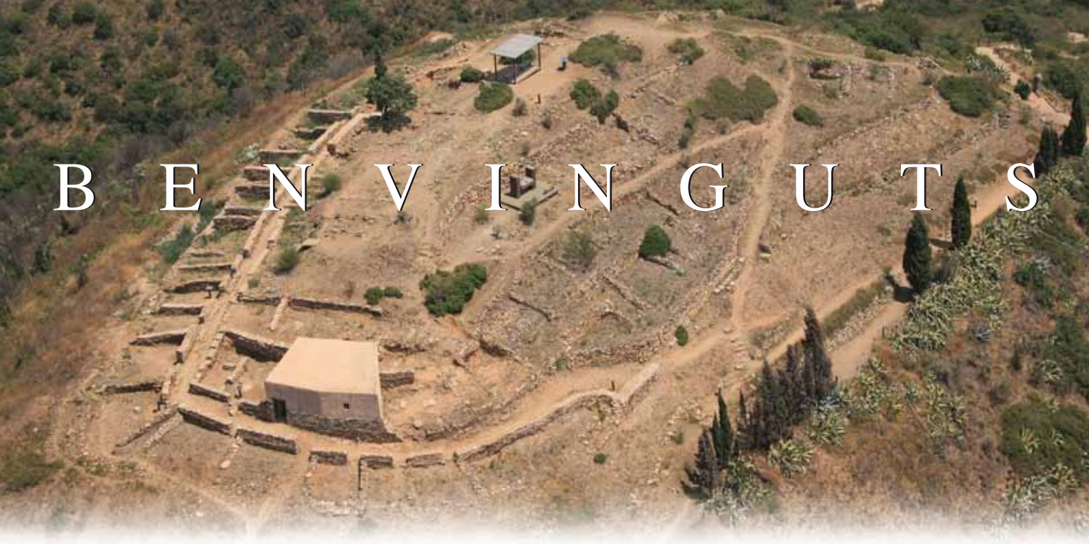
Vista aèria del jaciment Puig Castellar