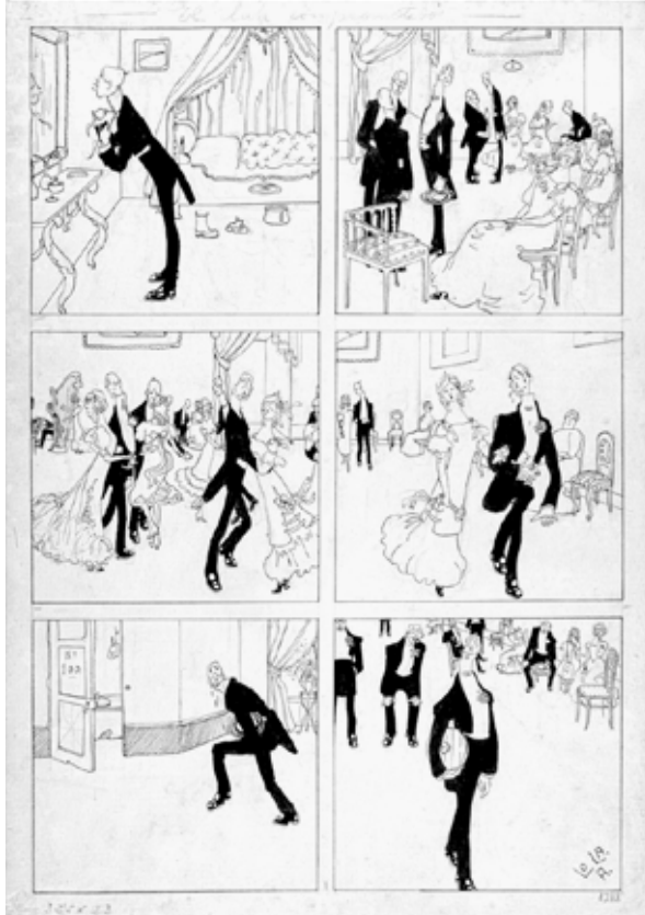
Carme Barbarà Il·lustració de La bomba. Mary «Noticias» , núm. 211 (Ibero Mundial de Ediciones). 1966. Diputació de Barcelona