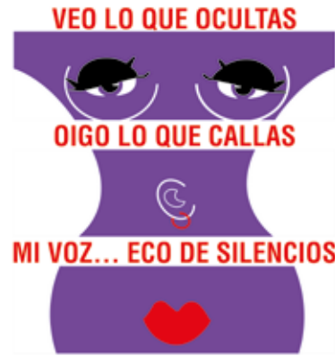
Marika Vila El cos okupat 2017 Col·leccio de l'artista

L'exposició Cossos que parlen. Les representacions del cos en les autores de còmic. 1910-2022 , explora com ha estat representat el cos de la dona en el còmic a través de la ploma de les autores en un recorregut cronològic que va des d'inicis del segle xx fins a l'actualitat.