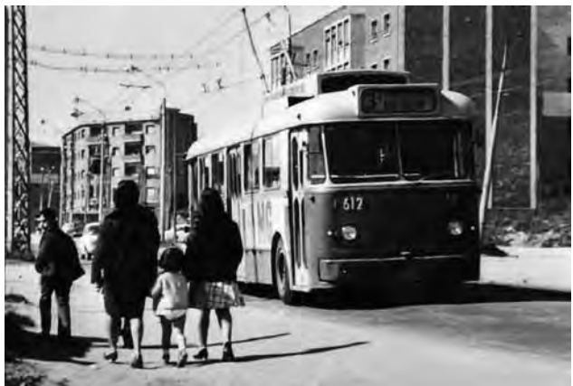
El boicot al 3, el 2 i 3 de setembre de 1968, va ser la primera lluita organitzada i consistent

El CU va posar en marxa una campanya d'informació i sensibilització mitjançant un full volander que anava signat per "Trabajadores de Santa Coloma". Convocava a una concentració pacífica per al 23 de febrer de 1971, a la plaça de la Vila, per reivindicar una assistència mèdica immediata i provisional i la construcció d'una clínica i no d'un ambulatori. Es van fer assemblees de barri a les parròquies i la ciutadania en parlava als bars i als mercats. Entre