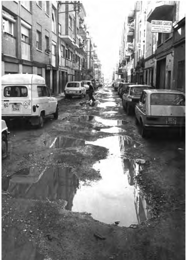
Carrer del barri Llatí sense urbanitzar / Litus Pedragosa

S'estava configurant una ciutat d'al·luvió, amb els carrers sense asfaltar i sense clavegueram, amb especulació urbanística i cases d'autoconstrucció i evidentment, sense infraestructures ni serveis. L'especulació descontrolada i la manca de planificació urbanística, propiciades pel poder municipal, van conduir la ciutat cap al caos urbanístic, amb una carença absoluta d'equipaments, de serveis, de zones verdes, etc. En aquesta situació, a meitat dels anys 60 es van desenvolupar dues dinàmiques que incidirien positivament en la realitat social i reivindicativa