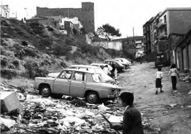
El suburbi en la seva màxima expressió: carrer sense asfaltar, sense clavegueram, cases d'autoconstrucció i brutícia

Un dels números més emblemàtics va ser el conegut com el Gramma del King Kong (núm. 43-44), en el qual es van publicar les dades d'un estudi encarregat per les parròquies de Santa Coloma i elaborat tenint en compte la legislació i els estàndards legals. Fet al llarg de 1971, xifrava en 4.516 milions de pessetes les necessitats globals de la ciutat. Es necessitaven 1.384 milions per a zones verdes i parcs, 843 milions per a construccions escolars, 690 per a construccions esportives, 590 per a obres urbanes com el clavegueram i 581 per a sanitat. Dades d'autèntic suburbi.