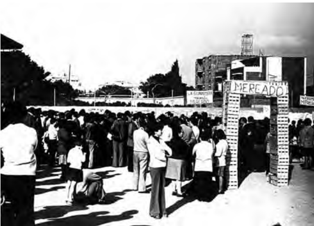
Acte de col·locació de la primera pedra simbòlica del mercat del Singuerlín el 24 d'abril de 1976