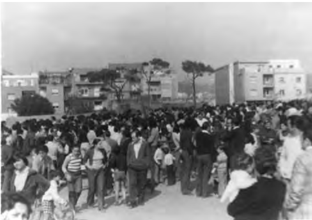
Una de les moltes ocupacions dels terrenys dels Pins (Motocròs) per reivindicar-lo com a zona verda i d'equipaments

A l'altra part de la ciutat, a la zona sud, passa el mateix amb resultats diferents. El juliol de 1973, l'Ajuntament aprova el Pla parcial pel sector del Motocròs que permetia l'edificació de blocs de fins a 15 pisos d'altura, mentre que les reivindicacions veïnals volien destinar les 8 hectàrees a equipaments i zona verda. S'obre un procés d'assemblees, impugnacions, ocupació dels terrenys amb activitats i repressió. El març de 1975, a iniciativa del Centre Social del Raval, es va fer una reunió insòlita a l'església del Raval, plena de gom a gom, a la qual